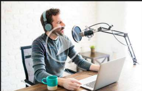
1. SPOTYISUS PODCAST-RADIO