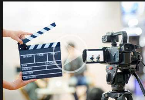
4. HOLLYCRIST EDICIÓN Y VIDEO