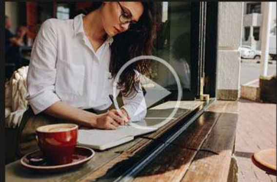
2. RISEN NEW REDACCIÓN