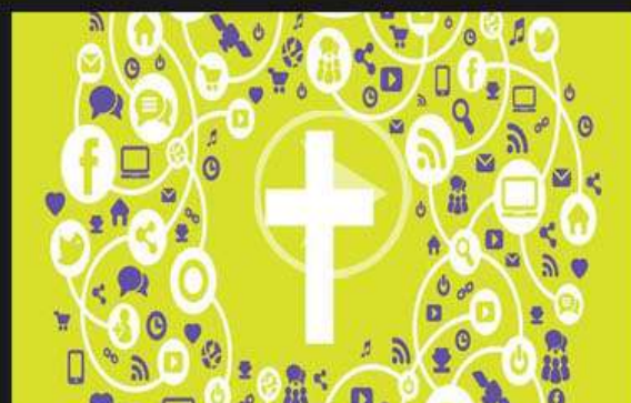
5. MASS MEDIA CHURCH IGLESIA Y RRSS