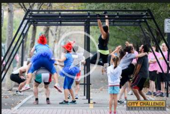
5. CHALLENGE 2.0